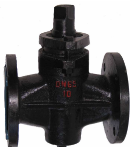
Główne części i materiały